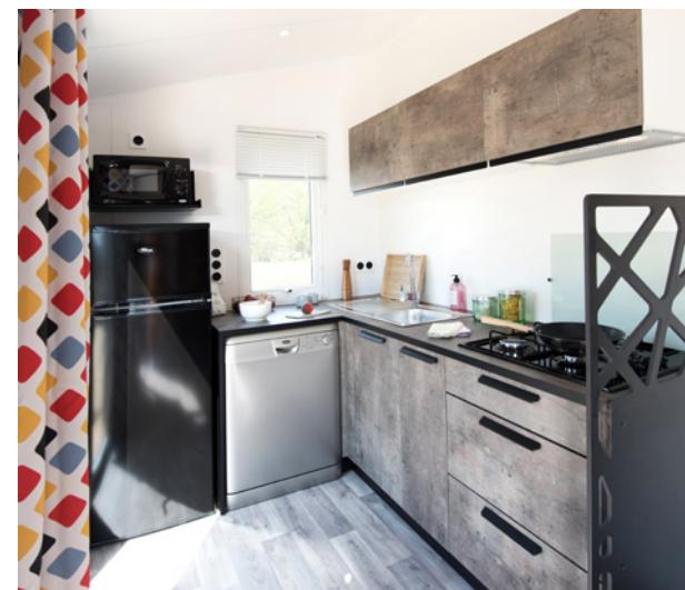
PRÉSENTÉ AVEC OPTIONS RÉFRIGÉRATEUR/CONGÉLATEUR ET LAVE-VAISSELLE